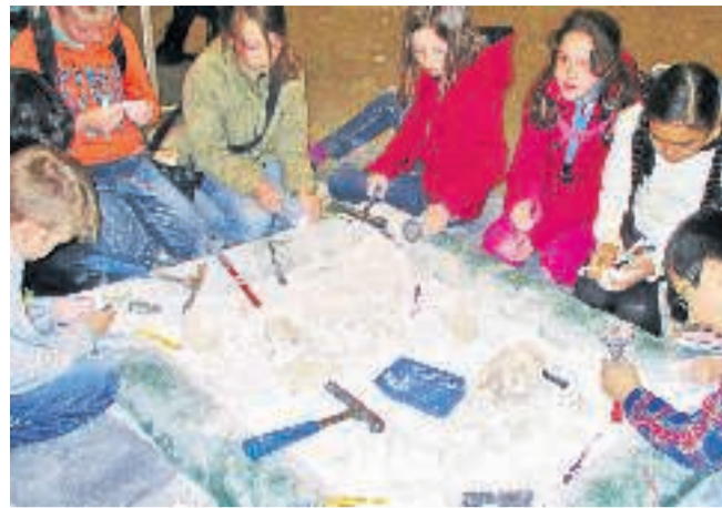
Arkivfoto fra Science Fair i 2015.